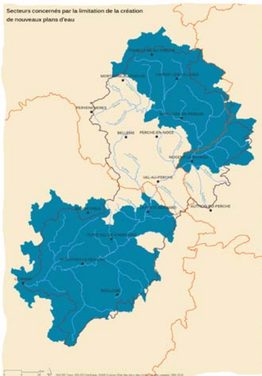
CARTE DE L'ARTICLE N°4 : LIMITER LA CRÉATION DE NOUVEAUX PLANS D'EAU

Cette règle ne concerne ni les retenues de substitutions, ni les plans d'eau de barrages destinés à l'alimentation en eau potable et à l'hydroélectricité relevant de l'article 4-7 de la Directive Cadre européenne sur l'Eau, ni les lagunes de traitement des eaux usées, ni les plans d'eau de remise en état des carrières, ni les plans d'eau utilisés exclusivement pour l'irrigation et/ou l'abreuvement du bétail, ni les étangs de pisciculture et d'aquaculture à vocation professionnelle.